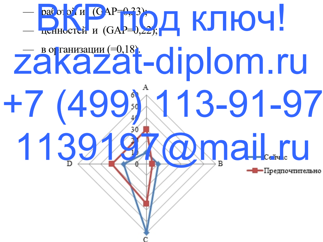
Рисунок 2.4. — Профиль элемента корпоративной культуры государственных служащих — «Важнейшие характеристики»