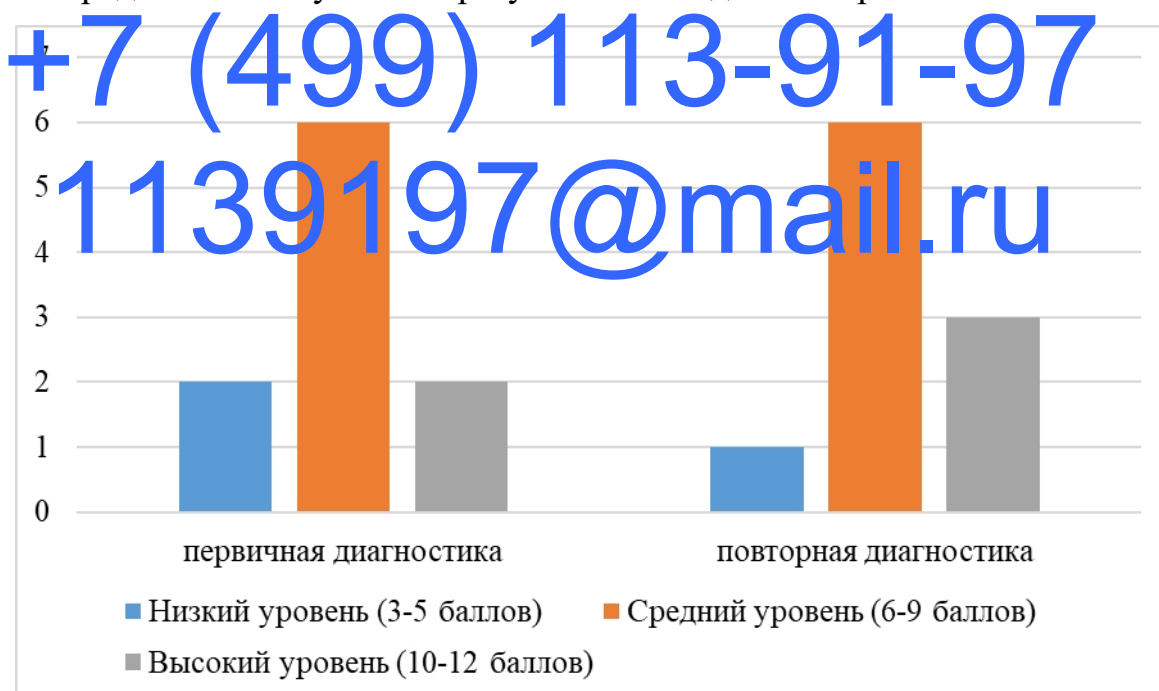
Рисунок 1 – Гистограммы частот уровня сформированности коммуникативных умений по методике «Рукавички»

Представим полученные результаты в виде гистограмм частот.